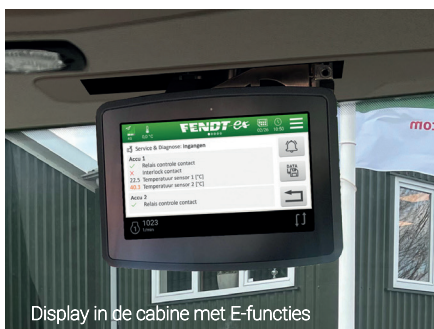
Display in de cabine met E-functies

Kijk voor meer details op www.fendt-e.nl